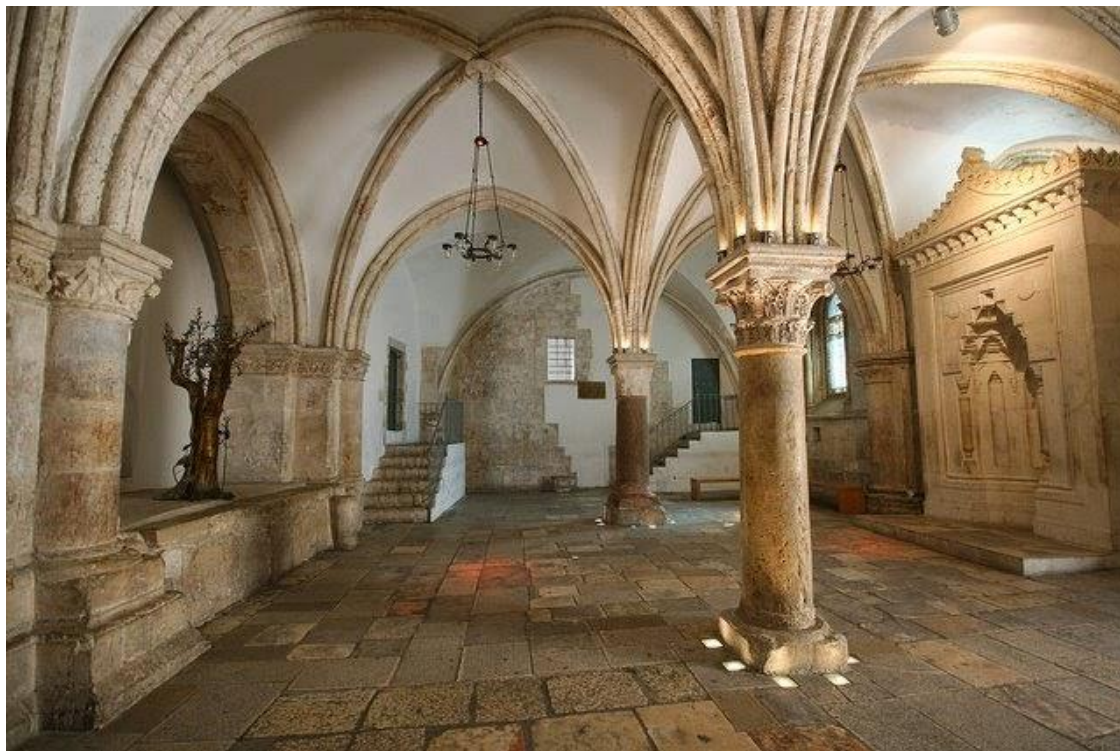
Večeřadlo na Siónu, místo první svaté Eucharistie, tzv. Tajemné Večeře 5