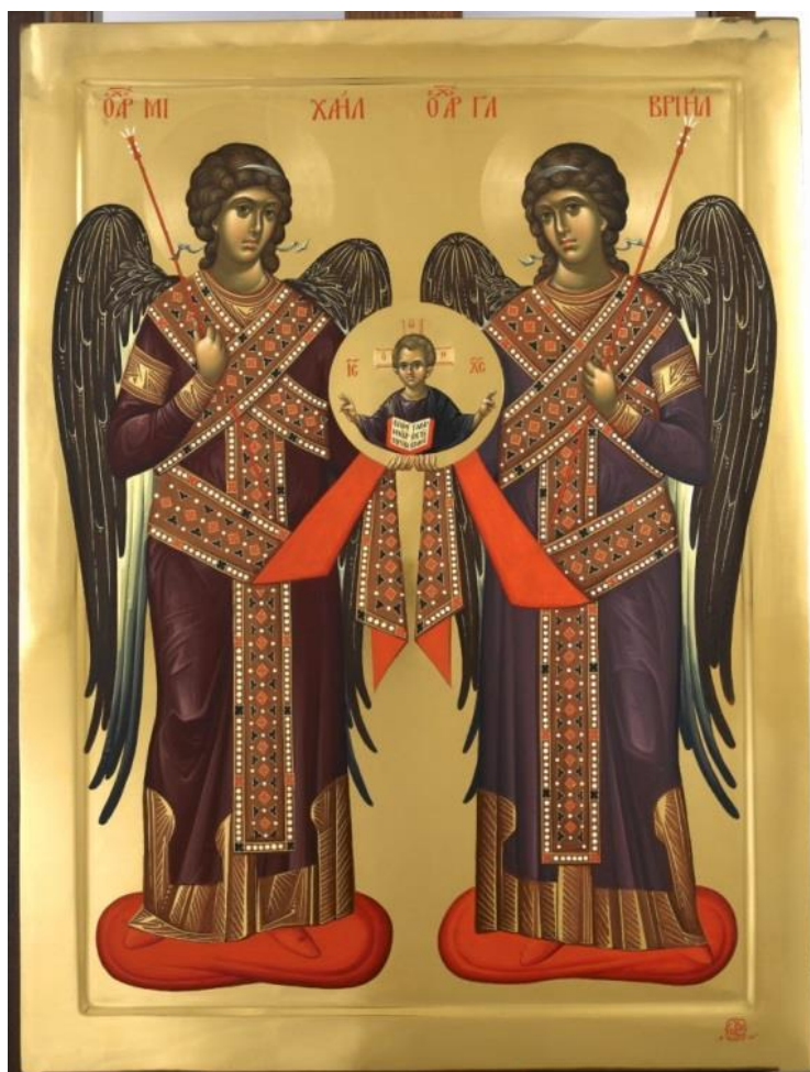
Ikonopisecká dílna Monastýru Vatoped