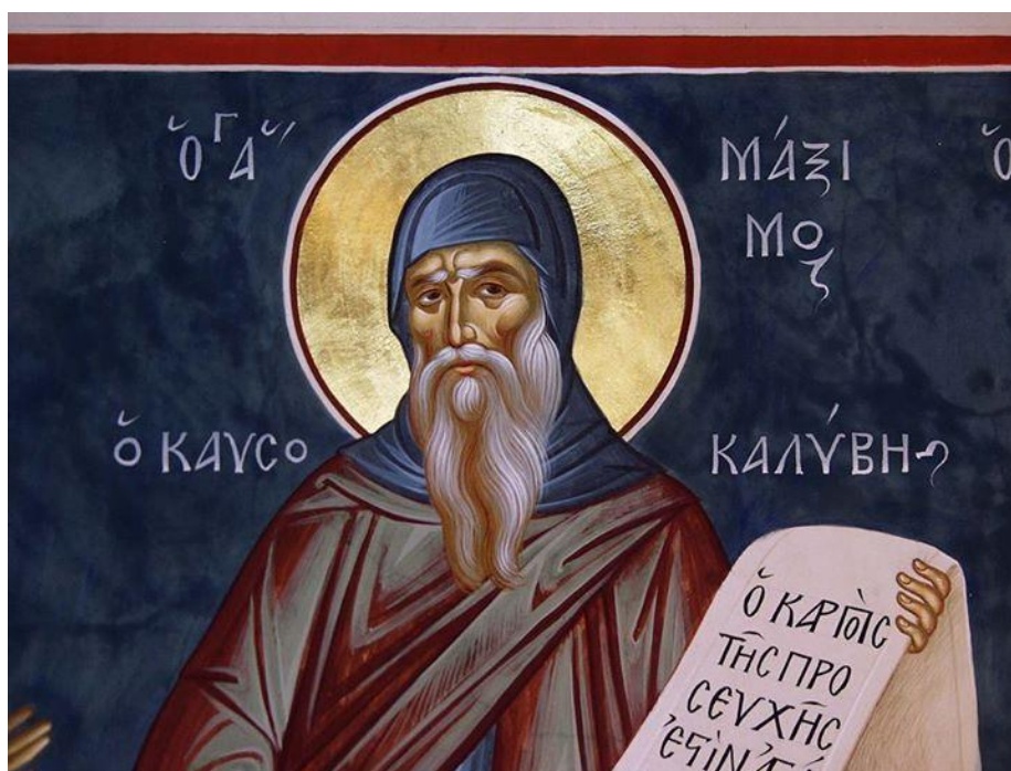
Ctihodný Maxim Kavsovalyvitký

Také dnešní otcové Svatohoroci vzpomínají na všechny místní Boží světce, kteří kdy v minulosti žili na Svaté Hoře, kteří tajemně čili mysticky ve svém srdci uzřeli a v blaženosti přijali Táborské světlo, „které osvětluje každého člověka“. Osvětluje však nejen člověka, který toto Světlo přijal do svého nitra, ale rovněž ty, kteří se přibližují do blízkosti svatých Božích a tímto Světlem zbožštěných lidí.